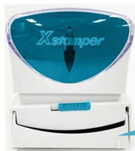
【シャッターが外れた状態】